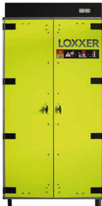
LOXXK1850 - Loxxer 1850