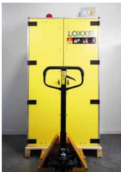
LOXK1850 -snadná manipulace, umístění